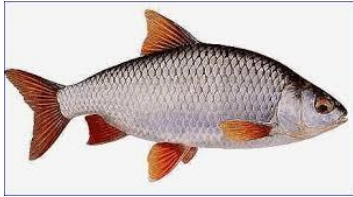
Figure 1: Gardon