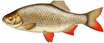
Figure 2: Rotengle

Le rotengle et le gardon sont des proches «cousins », mais comment les différencier ?